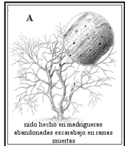
A nido hecho en madrigueras abandonadas escarabajo en ramas muertas