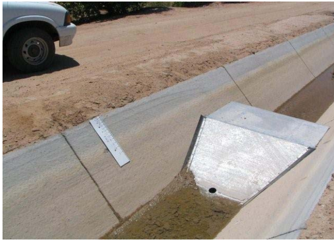
Water measuring flume installed in the field water supply channel of a grower's farm to help raise irrigation application efficiency